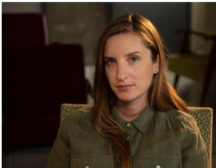
Urša Menart, režiserka in scenaristka