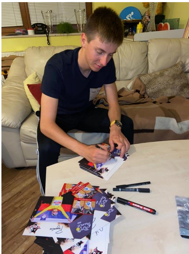
Tadej Pogačar, kolesarski šampion