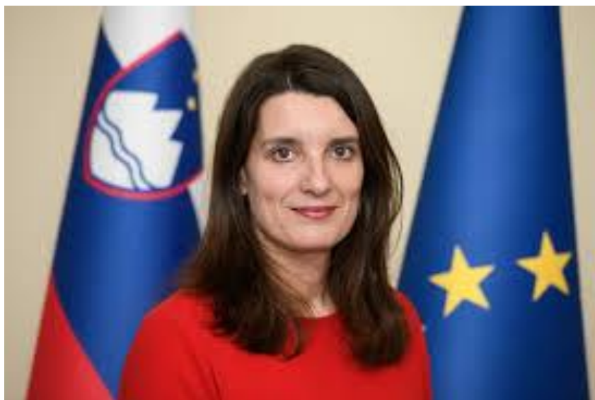
Ministrica, dr. Simona Kustec